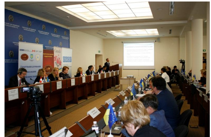
Проведено круглий стіл «Наступні кроки у реформуванні сфери правосуддя» в межах Щорічної зустрічі з питань людського виміру ОБСЄ