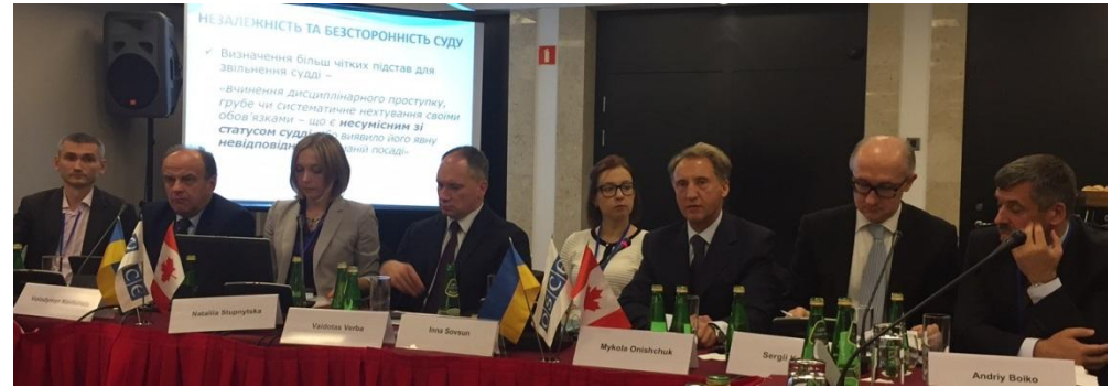
Участь представників НШСУ у Щорічній зустрічі з питань людського виміру ОБСЄ