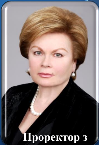
Проректор з науково-дослідної роботи та науково-методичної роботи