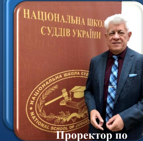
Проректор по забезпеченню організаційної діяльності