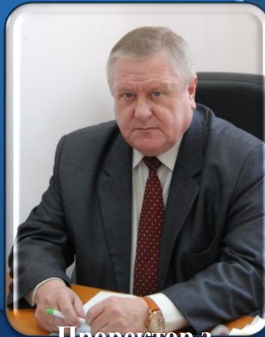
Проректор з підготовки кадрів для системи правосуддя