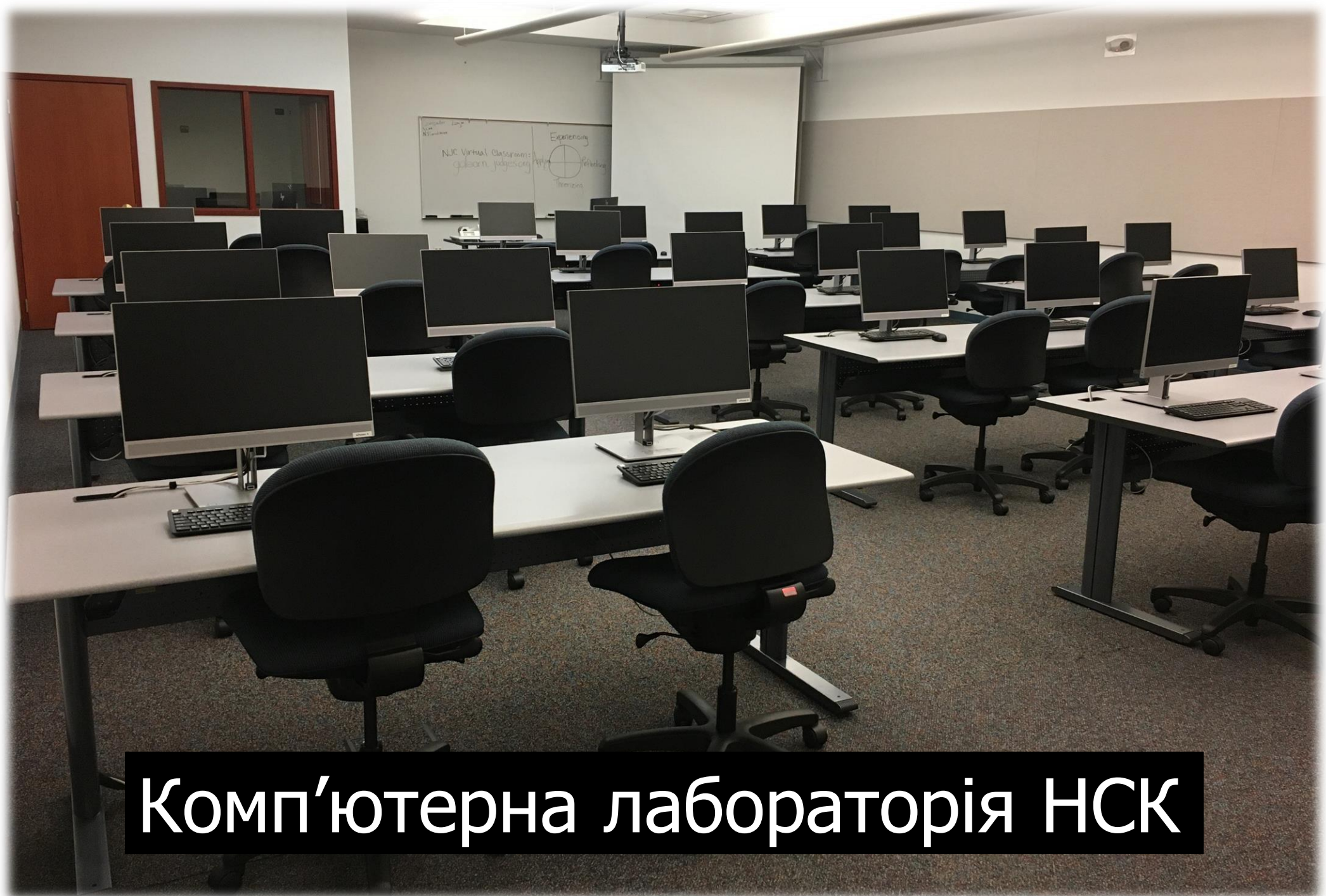
Комп'ютерна лабораторія НСК